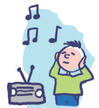
Peut être hypersensible aux sons, aux odeurs...